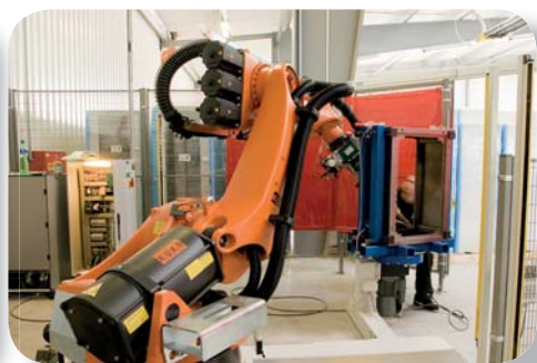
Robotizované svařovací pracoviště nástěnných rozvaděčů