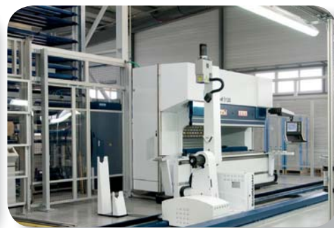
Ohýbací pracoviště TRUMPF - BENDMASTER