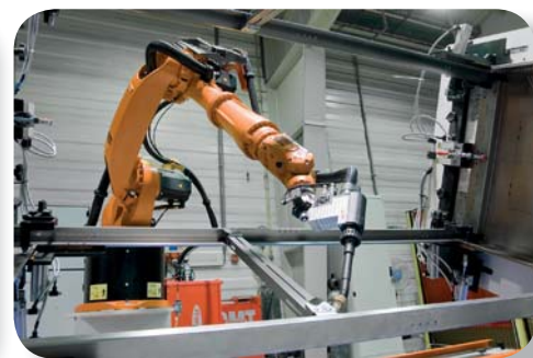
Robotizované svařovací pracoviště stojanových rozvaděčů