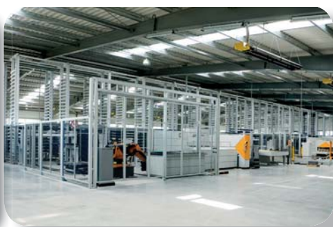
Ohýbací centrum RAS