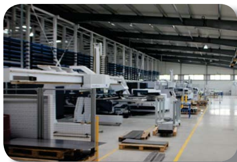
Vysekávací centrum TRUMPF-TRUPUNCH