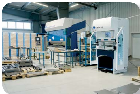
Ohýbací pracoviště TRUMPF-TRUBEND